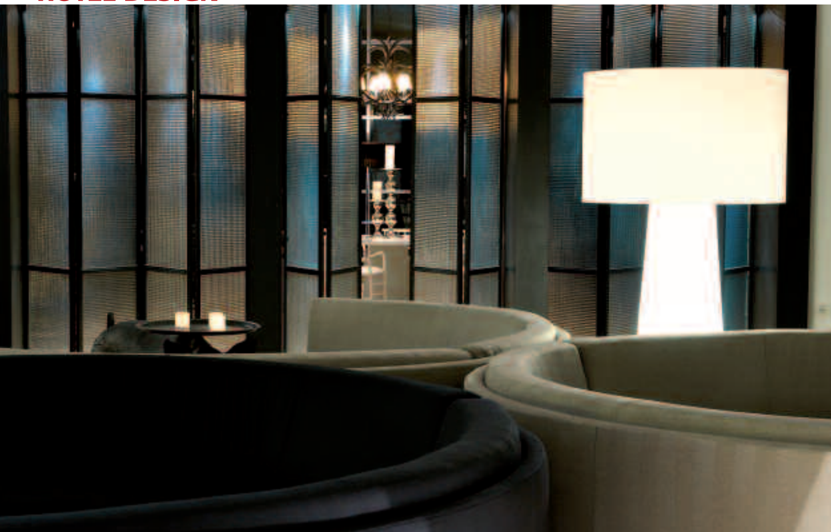
Il Dama Dama Restaurant propone specialità della cucina toscana in versione gourmet. I prodotti genuini usati per preparare i piatti provengono dalla Maremma o direttamente dall'orto biologico dell'hotel, che vanta la certificazione agroalimentare bioagricert

attrezzata Kinesis di Technogym e una cyclette con televisore. La Penthouse Suite è concepita come un attico rivestito da legni e pelli pregiate; dispone di una living-room con divani, camino e pouf in zebra, e di un'annessa sala da pranzo fornita di cantina personale. Nella camera da letto, separata da un prezioso paravento in pelle, spiccano la vasca da bagno free-standing e una zona studio con bureau in acciaio. L'Home Suite ruota attorno a un grande salone con camino ed è caratterizzata dall'uso di legni chiari, arredi vintage e candidi divani. La Master Suite, di gusto eclettico, coniuga lo stile west coast con la tradizione orientale; la Gallery Suite è invece dotata di minipiscina in mosaico Bisazza con cascate d'acqua e grande vetrata sulla terrazza panoramica, mentre la Club Deluxe Suite presenta arredi caldi e preziosi e una Jacuzzi doppia rifinita da legni esotici. Da segnalare anche l'ampio Locker Private Cottage posizionato su una collina a 200 metri dalla struttura principale, interamente votato al relax e al benessere, con interni caldi e accoglienti che rivoluzionano l'idea di country house toscana con un tocco glamour ed eclettico. Dispone di un grande salotto e di una cucina che si affaccia sul patio, oltre che di una suite padronale e due camere dotate di bagno privato.