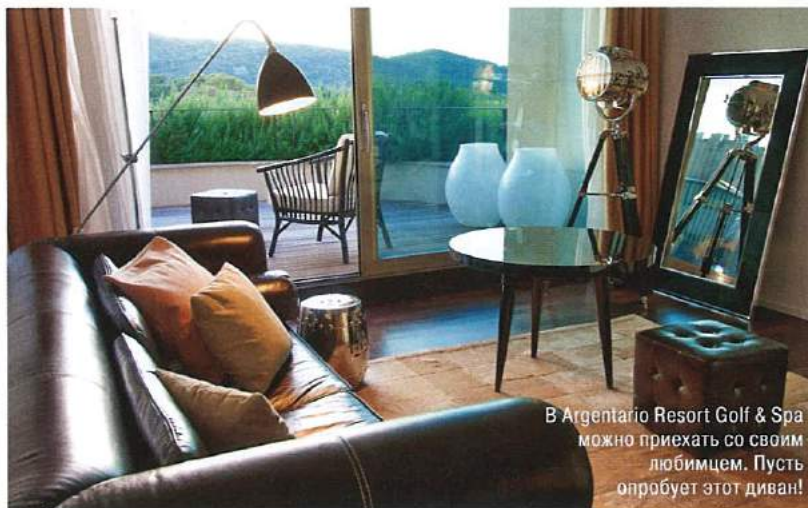
В Argentario Resort Golf & Spa можно приехать со своим любимцем. Пусть опробует этот диван!