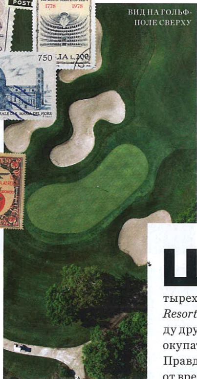
ВИД НА ГОЛЬФ-ПОЛЕ С ВЕРХУ

Ш еринг-экономика правит бал и на Апеннинском полуострове. Владельцы четырех новых вилл Argentario Golf Resort & Spa смогут сдавать их в аренду другим гостям – и таким образом окупать собственные инвестиции. Правда, для этого им придется время от времени покидать среду обитания, а сделать это будет ох как непросто. К идеальным проборам виноделен, изумрудной дымке оливковых рощ, небесной синеве лагуны Орбетелло и прочим атрибутам тосканской романтики привыкаешь быстро и необратимо, а отсутствие дресс-кода подкупает даже охотниц за самыми горячими аксессуарами сезона. Дальше – больше: ощущение, что все здесь на своих местах, вызывают и интерьеры. Они у дизайн-студии Andrea