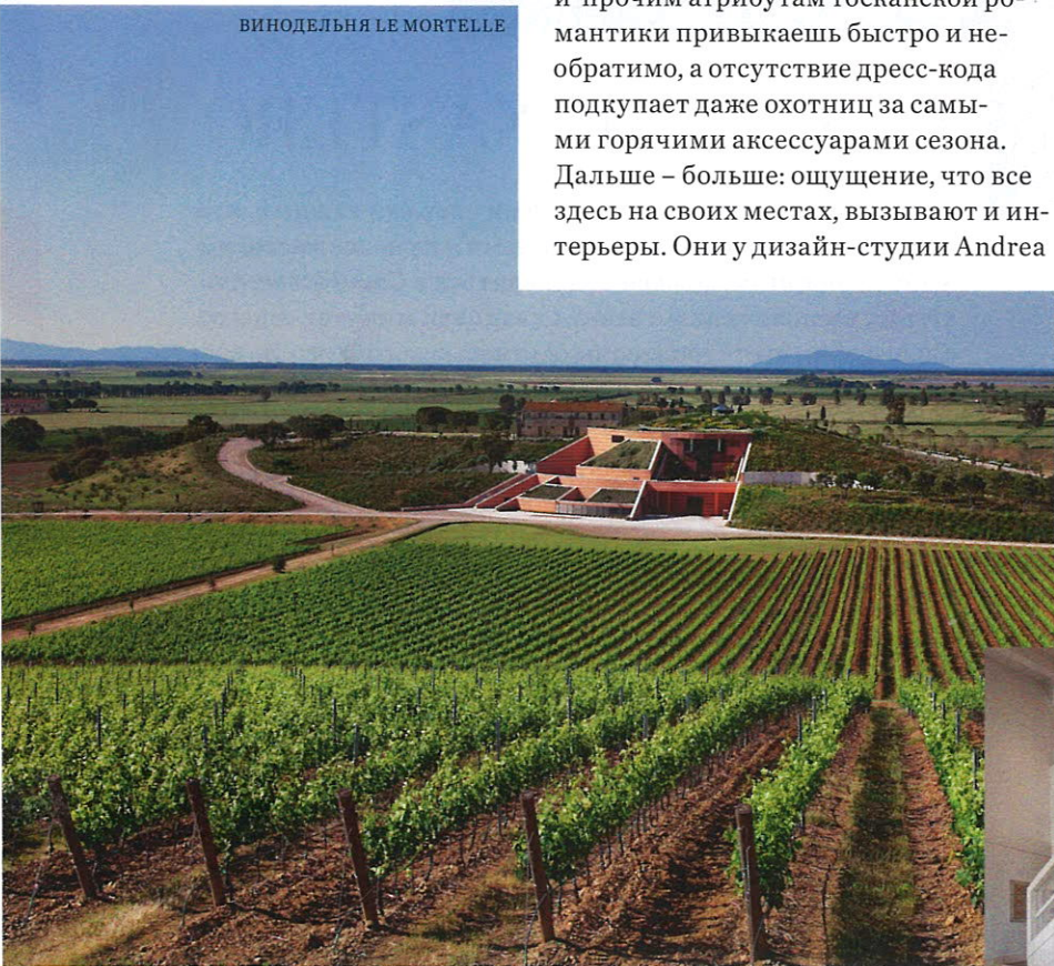
ВИНОДЕЛЬНЯ LE MORTELLE

Fogli, Stefania Tognoloni & Partners получились в хорошем смысле слова сдержанными. Ничего надуманного, нарочитого или вырванного из контекста. Архитекторы предложили три варианта оформления пространства – в модернистском ключе, с ретроакцентом или в духе рустикального шика. Ну а в дополнение к нескромным владениям (резиденции рассчитаны на большое число гостей, вплоть до двенадцати человек) – круглосуточное обслуживание и неограниченный доступ к фасилитис курорта: гольф-полям, теннисным кортам, спа и фитнес-центрам, гастрономическим ресторанам, пляжу Il Tramonto и вертолетной площадке. МАРИЯ СОРОКИНА