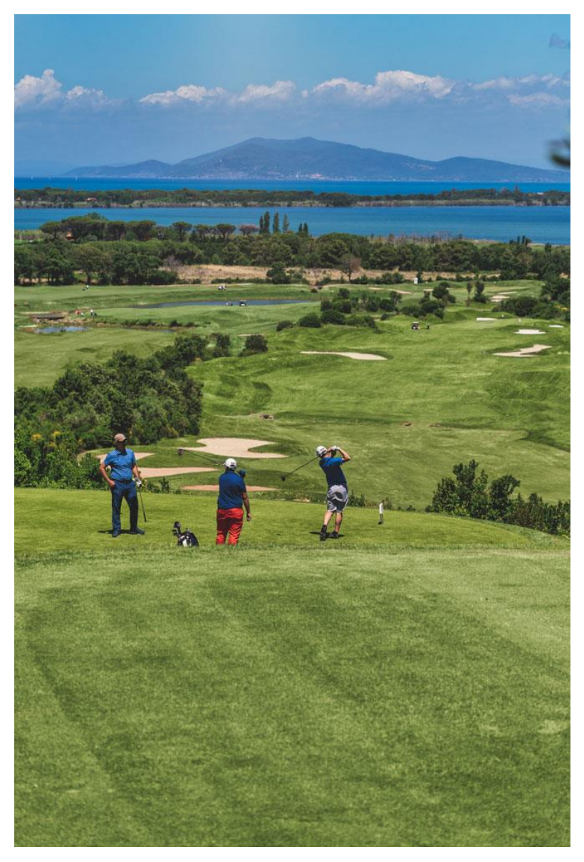
Campo da golf

https://www.theducker.com/art-de-vivre/argentario-golf-wellness-resort-lusso-natura-e-innovazione_in-maremma/