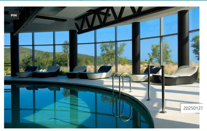
Piscina del wellness center

https://www.theducker.com/art-de-vivre/argentario-golf-wellness-resort-lusso-natura-e-innovazione-in-maremma/